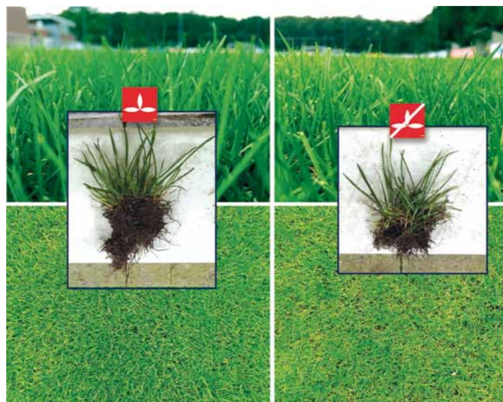
PSV-gras mét en zonder Magnation-behandeling.